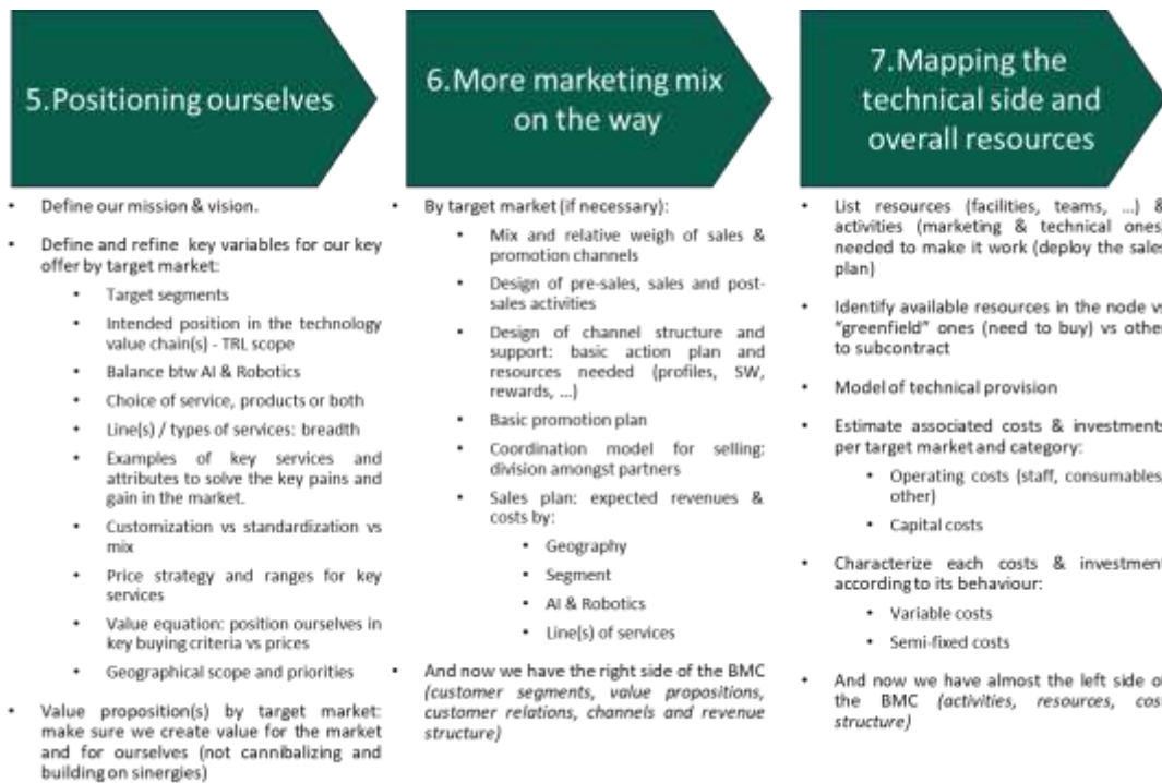
Ilustración 3- Bloques 5-6-7