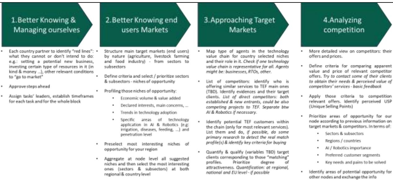
Ilustración 2- Bloques 1-4